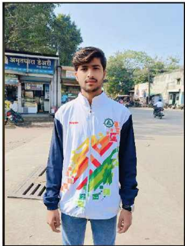
University Champion of College of Agriculture, Umarkhed Year 2024-25