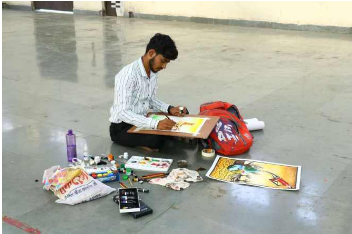
Students Participated in Youth Festival in Painting Competition at Dr. P. D. K. V. Akola