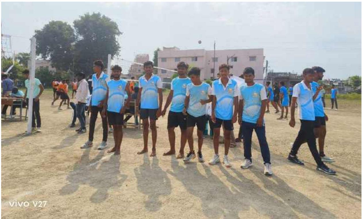
Students Participated in Inter Collegiate Sports (Volley Ball Team-Boys) At. Dr. P. D. K. V. Akola