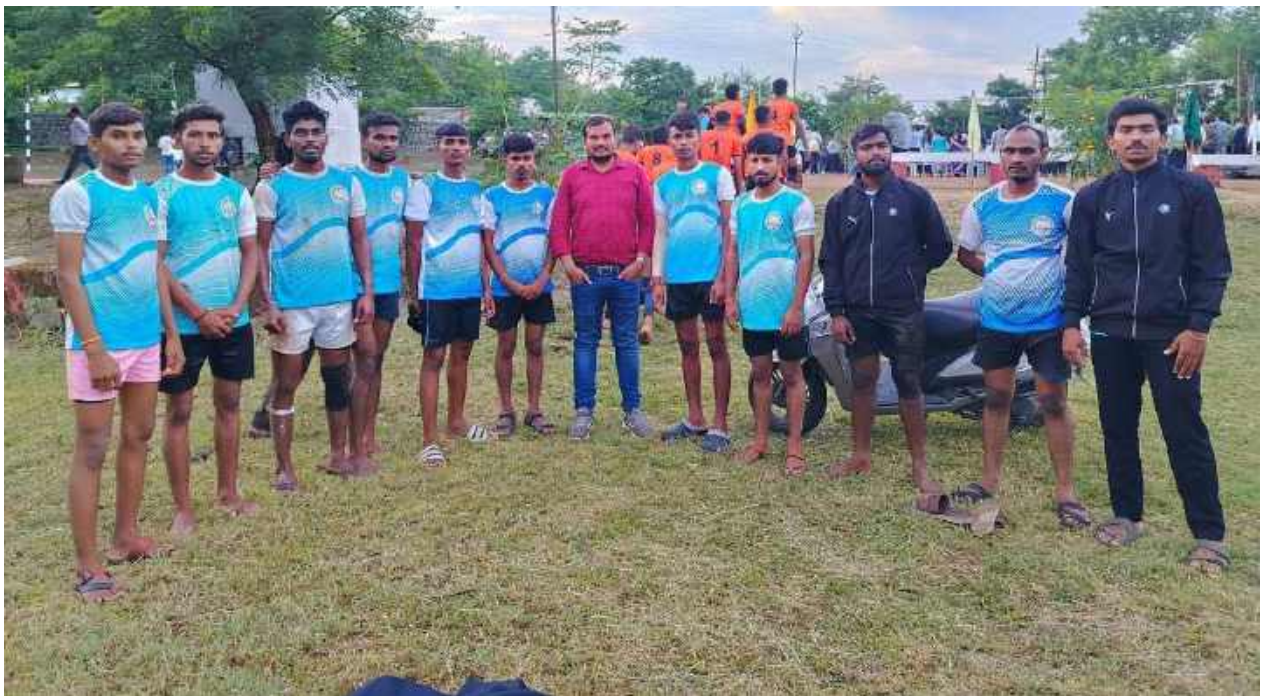
Students Participated in Inter Collegiate Sports (Kabaddi) At. Wardha