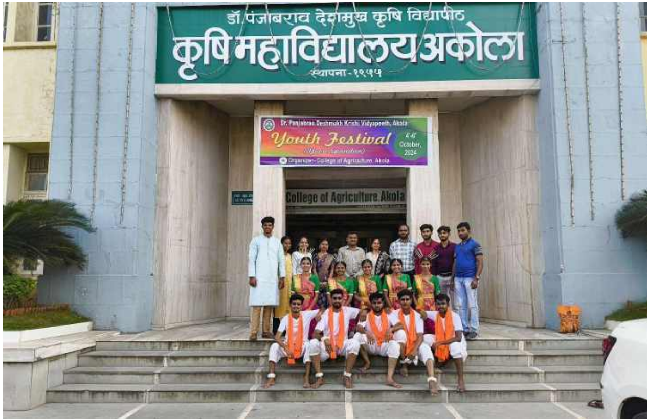
Students Participated in Youth Festival at Dr. P. D. K. V. Akola