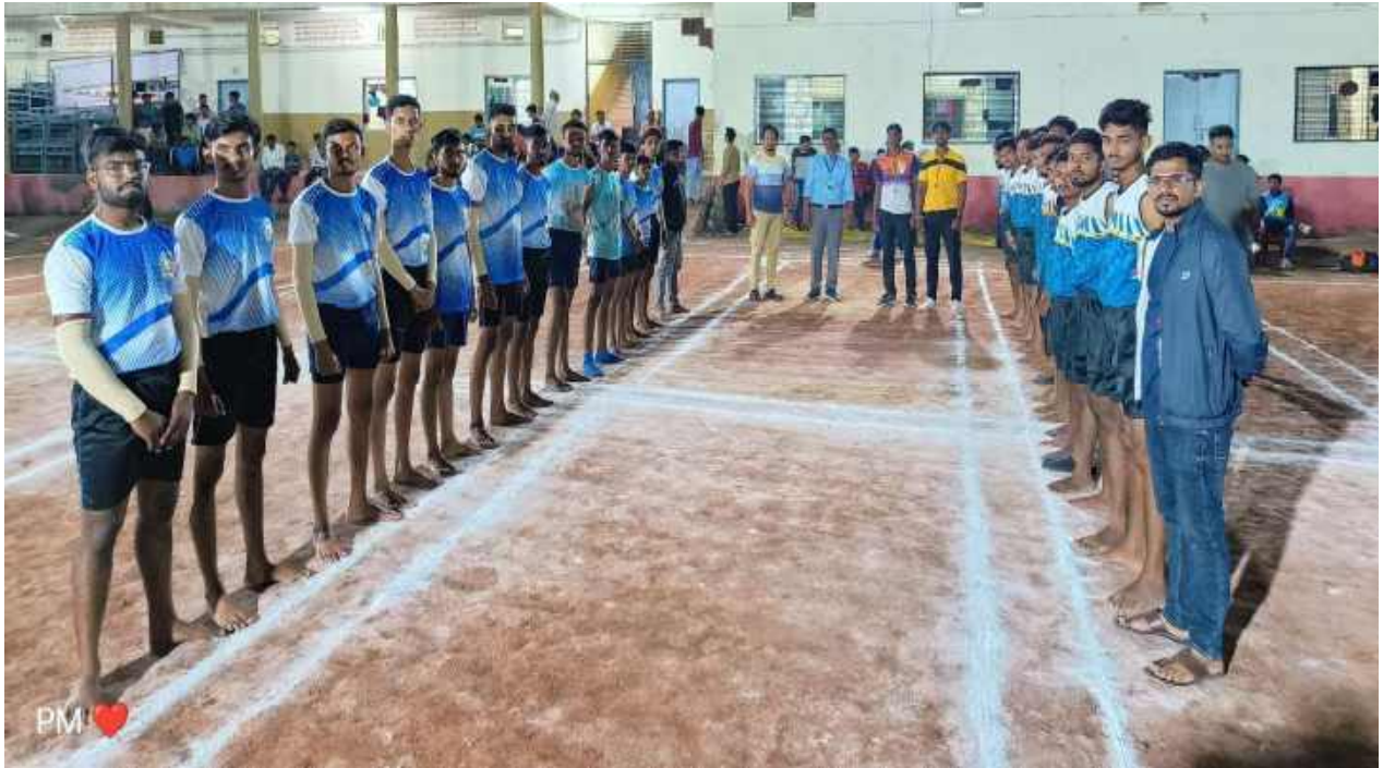
Students Participated in Inter Collegiate Sports (Kho-Kho Boys) At. Dr. P. D. K. V. Akola