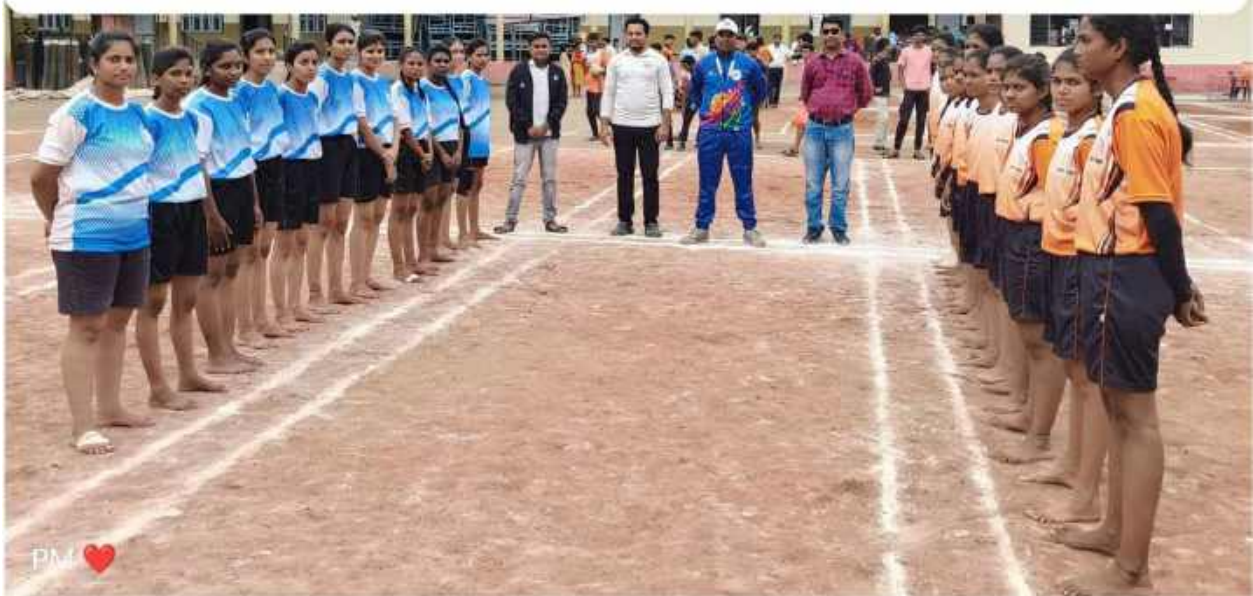
Students Participated in Inter Collegiate Sports (Kho-Kho Girls) At. Hiwara Ashram Dist.Buldana