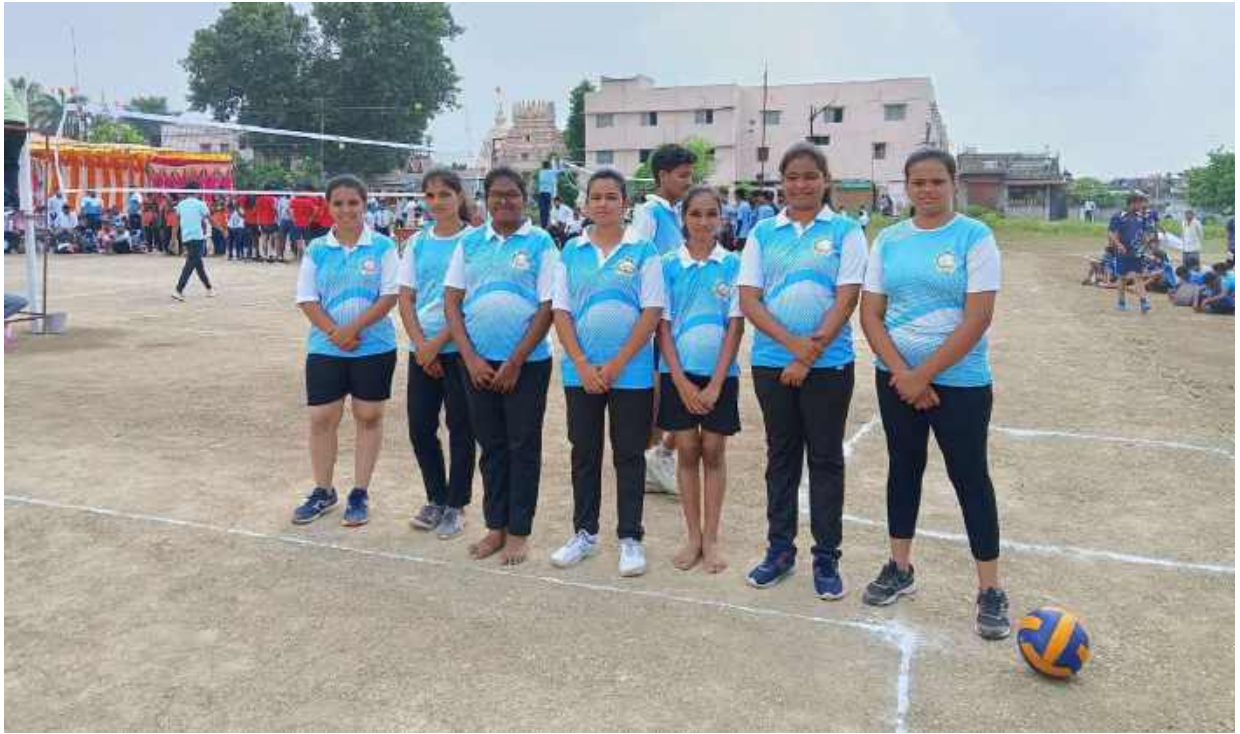
Students Participated in Inter Collegiate Sports (Volley Ball Team-Girls) at Wardha