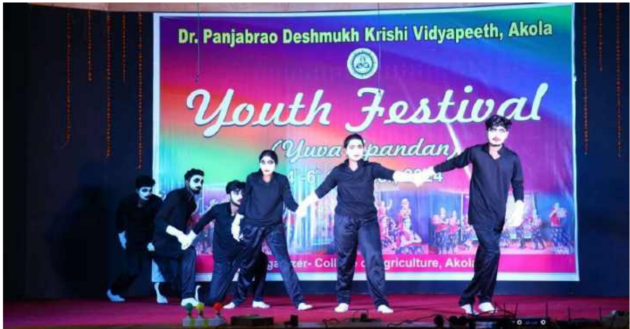
Students Participated in Youth Festival in MIME at Dr. P. D. K. V. Akola