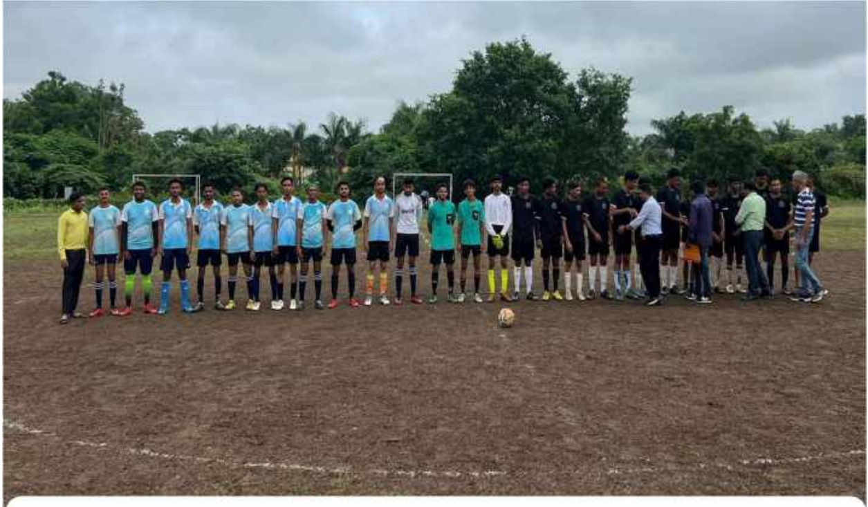
Students Participated in Inter Collegiate Sports (Football Team) At. Dr. P. D. K. V. Akola