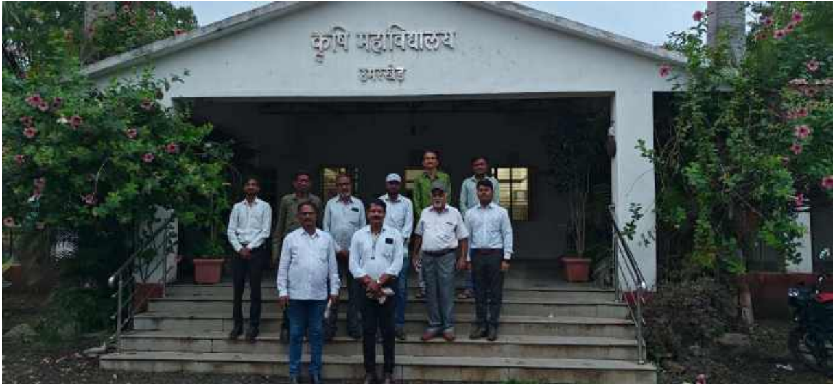
Officials of Sakal Vidarabha region gave a courtesy visit to College of Agriculture, Umarkhed