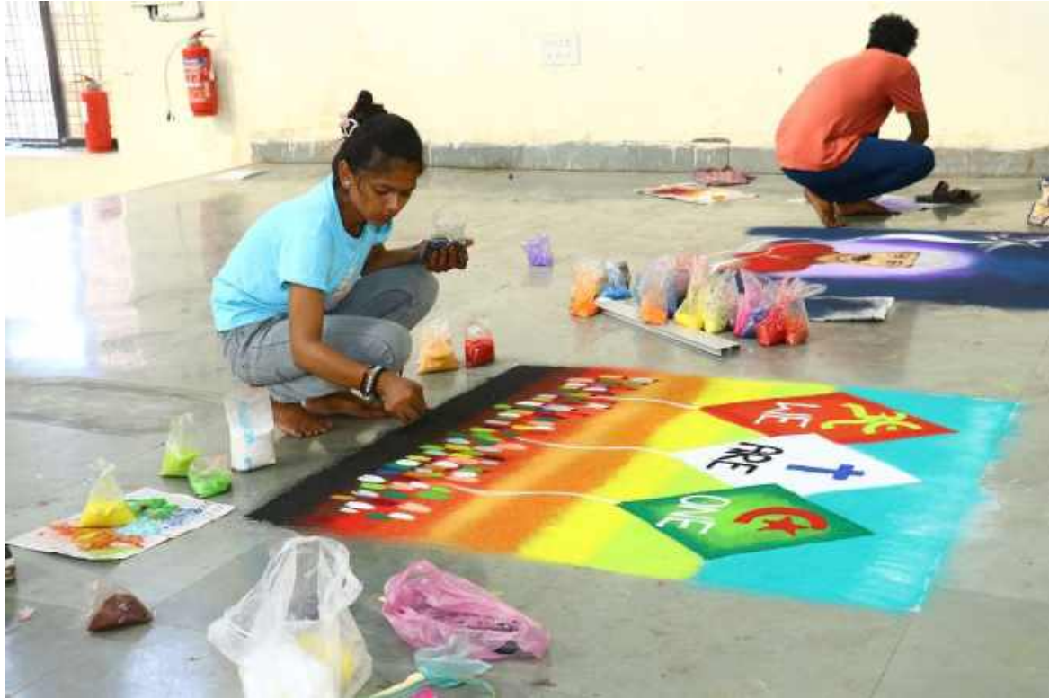
Students Participated in Youth Festival in Rangoli Competition - Girls at Dr. P. D. K. V. Akola